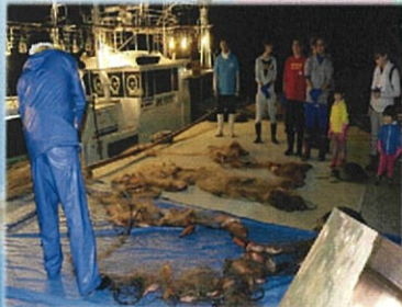
網から外す前 (水揚げ)