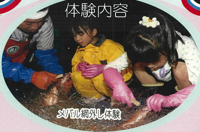
メバル網外し体験