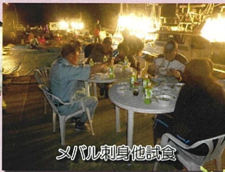
メバル刺身他試食